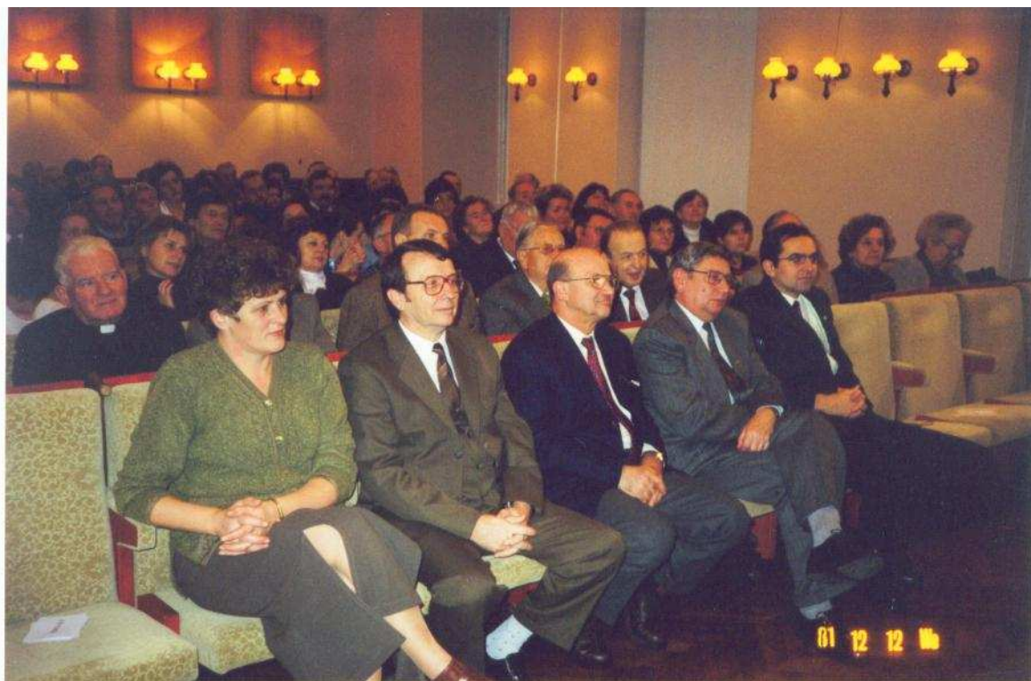
8. Fotó: Az előadás hallgatósága.