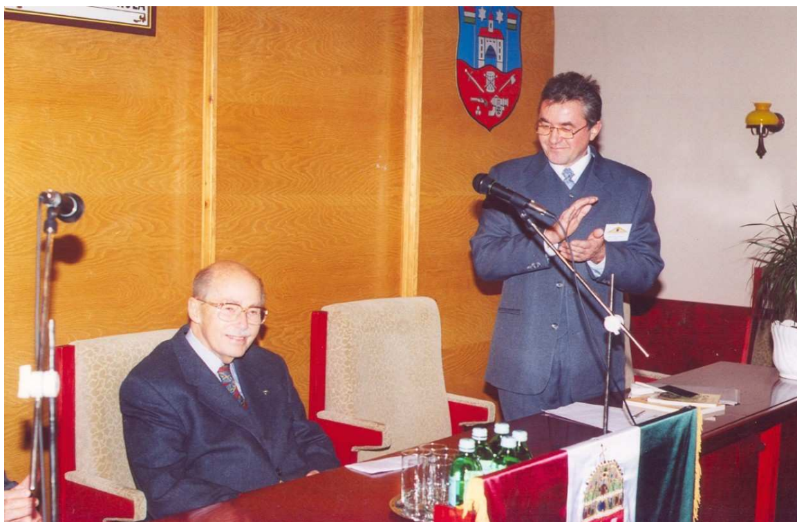
9. Fotó: előadás végén a közönség hosszan tapsolta a Főherceg urat.