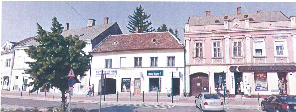
A Fő tér utca 8. és a szomszédos helyi védett épületek (Google utcakép)

A helyi védett épületek listája a településképi rendelet 2017. év végi jóváhagyása óta újra felülvizsgálatra került az önkormányzat részéről; a Fő tér 8. szám alatt álló épület nem képvisel megtartandó építészeti értéket, az utcaképbe sem illeszkedik teljes mértékben: alacsonyabb párkánymagasság a szomszédos épületekhez képest, hózugot képező tetőforma stb.